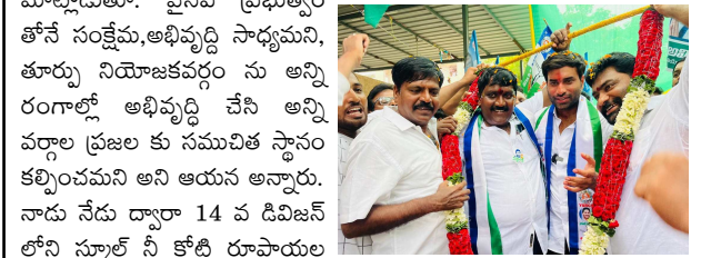
అన్ని వర్గాల సంక్షేమానికి జగనన్న కృషి