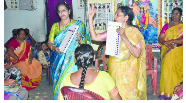
నాయకులు, కార్యకర్తలు పాల్గొన్నారు.