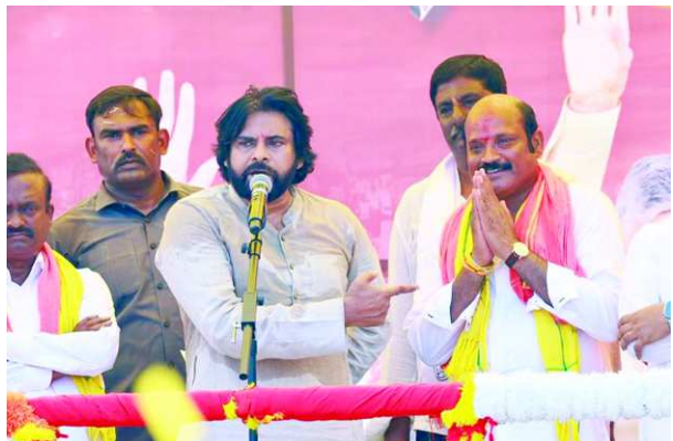
ప్రభుత్వం పట్ల అన్ని వర్గాల ప్రజలు తీవ్ర వ్యతిరేకతతో ఉన్నారని తెలియజేశారు. సంక్షేమం, అభివృద్ధి సమానంగా కూటమి ప్రభుత్వం పాలన

హనుమాన్ జంక్షన్, మే 8, మేజర్ న్యూస్ : జన సైనికులు ఈ నెల 13వ తేదీ జరగనున్న సాధారణ ఎన్నికల్లో కూటమి అభ్యర్థులకు ఓట్లు వేసి భారీ మెజార్టీతో గెలిపించాలని జనసేన అధినేత పవన్ కళ్యాణ్ పిలుపునిచ్చారు. మంగళవారం మధ్యాహ్నం కృష్ణాజిల్లా హనుమాన్ జంక్షన్ లో జరిగిన ఎన్నికల ప్రచార సభలో ఆయన ప్రసంగిస్తూ రాష్ట్ర అభివృద్ధి సంక్షేమం కోసం టిడిపి, జనసేన, బిజెపిల ఎన్నికల పొత్తు పెట్టుకున్నామని, ఈ పొత్తుకు రాష్ట్ర ప్రజలందరూ సంపూర్ణ మద్దతు తెలియజేశారని చెప్పారు. రాష్ట్రంలో అరాచక పాలన అరికట్టేందుకు ప్రజలందరూ ముందుకు రావాలని పిలుపునిచ్చారు. ఈ ప్రభుత్వం అధికారంలోకి వచ్చిన తర్వాత ఇసుక ధరలు పెరిగిపోవడంతో భవన నిర్మాణ కార్మికుల పై తీవ్ర ప్రభావం చూపించాయి అన్నారు. ప్రతిపక్ష నాయకుల పై వేధింపులు దాడులు బూతులతో విరుచుకు పడటం మినహా ఈ ప్రభుత్వం సాధించింది ఏమీ లేదన్నారు. ప్రభుత్వ వైఫల్యాలను ప్రశ్నించిన వారిపై దాడులు చేస్తూ అక్రమ కేసులు పెడుతున్నారని ఆరోపించారు. ఈ