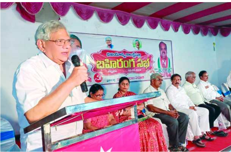
వెనుకబడిన రాయలసీమ, ఉత్తరాంధ్రా ప్రాంతాల ప్రత్యేక ప్యాకేజీని