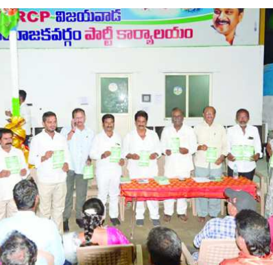
ఆర్కవైశ్యులు ఆర్కవైశ్య నాయకులతో చంద్రబాబు మాట్లాడి పాల్గొన్నారు.

చాలా విజ్ఞులు అని కొనియాడారు. వారు ఎటువైపు నిలబడితే ఆ పార్టీ అధికారంలోకి వస్తుందన్నారు. ఈ సారి ఆర్కవైశ్యులు తొంభై శాతంకి పైగా టీడీపీకి మద్దతుగా నిలుస్తున్నట్లు సర్వేలు చెబుతున్నాయన్నారు. చంద్రబాబు ఆర్కవైశ్యుల ఆకాంక్షలకి ప్రతిబింబించే విధంగా మ్యూనిసిపాలిటీ లో కోణిజేటి రోశయ్య స్మృతి వనం ఏర్పాటు చేస్తామని పొందుపర్చారు. అలాగే