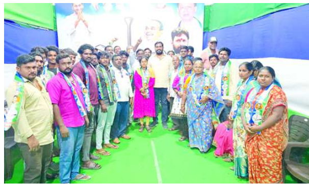
కల్పించడానికి... 13వ వార్డు బాపూజీ నగర్ నుండి పెద్ద సంఖ్యలో నేడు వైఎస్ఆర్ కాంగ్రెస్ పార్టీలో చేరారని... ఇలా ప్రతి వార్డు నుండి భారీగా