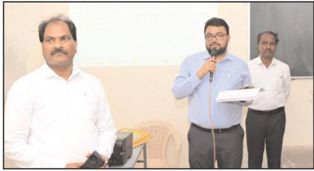
మంచిర్యాల, ఏప్రిల్ 30, సూర్య మేజర్ న్యూస్ :