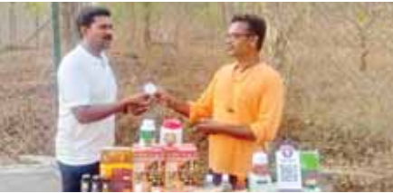
బ్యాడ్జిలు పంపిణీ చేస్తున్న మునిసిపల్ సిబ్బంది