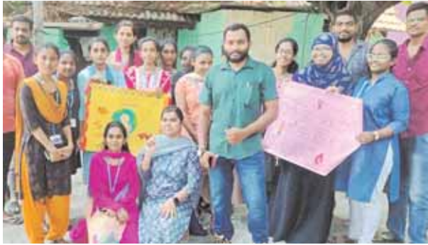
క్యాన్సర్ పై అవగాహన చేపట్టిన ఇంజనీరింగ్ విద్యార్థులు

రేణిగుంట, మేజర్ న్యూస్: రేణిగుంటలో శ్రీ వేంకటేశ్వర కాలేజ్ ఆఫ్ ఇంజనీరింగ్ కళాశాల ఇంజనీ రింగ్ డిస్టింక్షన్ సంవత్సర విద్యార్థులు క్యాన్సర్ పై అవగాహన కార్యక్రమం చేపట్టారు. పట్టణంలోని పలు వీధుల్లో ఇంటింటికి క్యాన్సర్ పై అవగాహన మరియు ఆధునిక వైద్య విధానం పై కార్యక్రమం నిర్వహిస్తూ కార్యక్రమం చేపట్టారు.