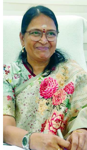
పింఛన్న ఇస్తారని తెలిపారు.