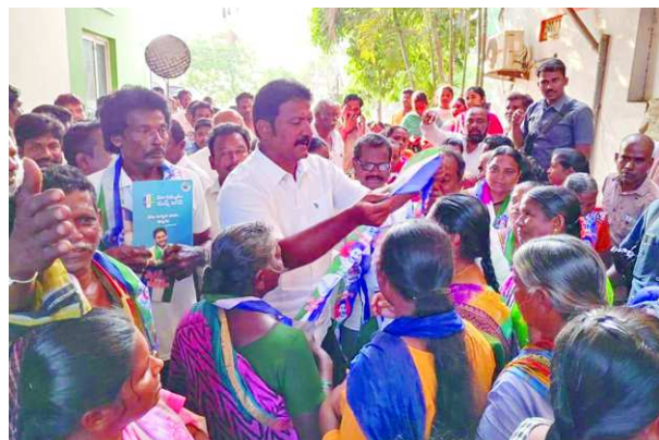
గన్నవరం, ఏప్రిల్ 30, మేజర్ న్యూస్:పేద, బడుగు, బలహీన వర్గాల