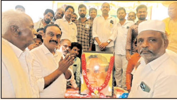
నరసరావుపేట, మేజర్ న్యూస్