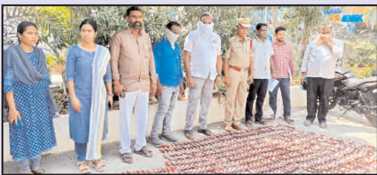
పిడుగురాళ్ల, మేజర్ న్యూస్

మే 2౦ పిడుగురాళ్ల పట్టణ శివారులోని పల్నాడు బార్ అండ్ రెస్టారెంట్ వద్ద భారీగా మద్యం బాటిల్స్ ను అధికార్లు పట్టుకోవడం జరిగింది. అలానే పరిమితికి మించి తరలిస్తున్న 1050 క్వార్టర్ బాటిల్స్ ఉన్న మద్యం బాటిల్లను ఎన్ఫోర్స్ మెంట్ స్టాండ్ , పిడుగురాళ్ల సేబ్ సిబ్బంది స్వాధీనం చేసుకున్నారని తెలిసింది. సుమారు వాటి విలువ 2 లక్షల ఉంటుందన్న సేబ్ అధికారులు పేర్కొన్నారు. మద్యం బయటకు సరఫరా ఇస్తున్న పల్నాడు బార్ అండ్ రెస్టారెంట్ ని సేబ్ అధికారులు నిజ్ చేసారు. మద్యం తరలిస్తున్న కారును, ఇద్దరు వ్యక్తులను అధికారులు అదుపులోకి తీసుకున్నారు. పూర్తి వివరాలు తెలియాల్సి ఉంది.