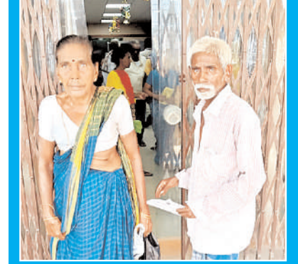
కారంపూడి, మేజర్ న్యూస్

◀ పింఛన్ డబ్బులు అకౌంట్ లో వేసామని చెప్పన్నా అధికారులు ◀ పింఛన్ సొమ్ము చేతికి అందక అవ్వతాతల ఇక్కట్లు