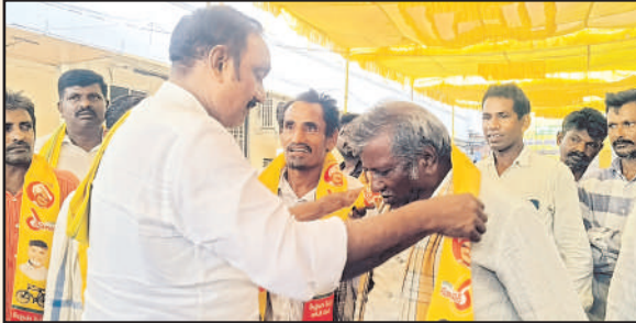
నరసరావుపేట, మేజర్ న్యూస్