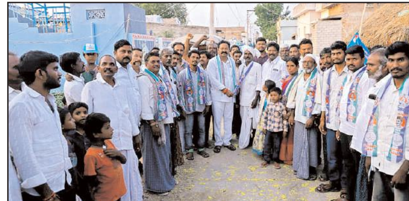
కుటుంబ సభ్యులుగా మీకు పార్టీలో తగిన గుర్తింపు గౌరవం ఉంటుందని వారు తెలిపారు.