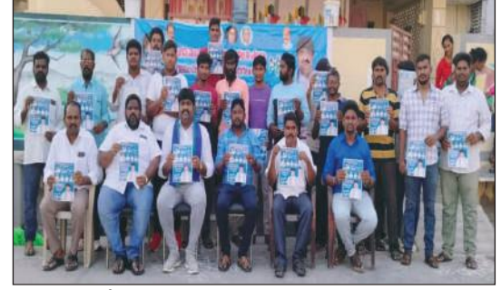
మాదిగలకు చేసిన పథకాలు వివరించి ప్రతి గడవ గడవకు తిరిగి ప్రతి మాదిగ కుటుంబానికి