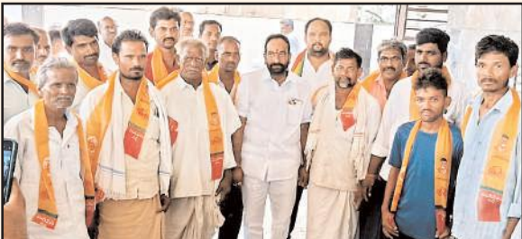
మాచర్ల, మేజర్ న్యూస్