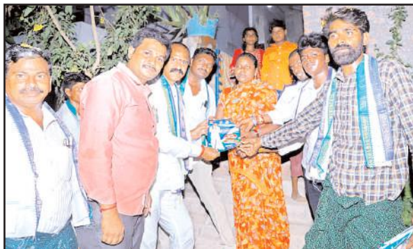
నూజిండ్ల, మేజర్ న్యూస్