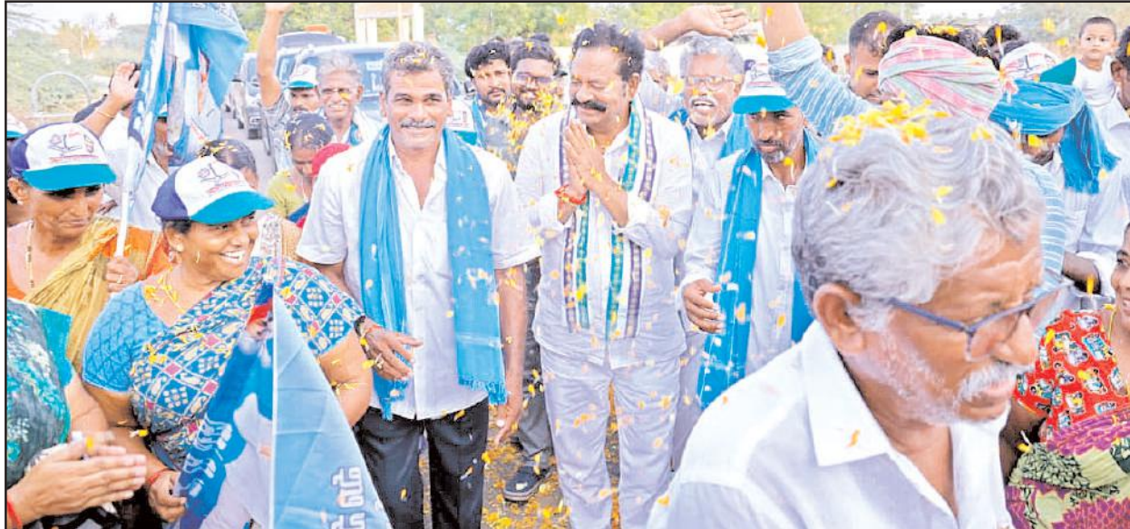
వినుకొండ, మేజర్ న్యూస్