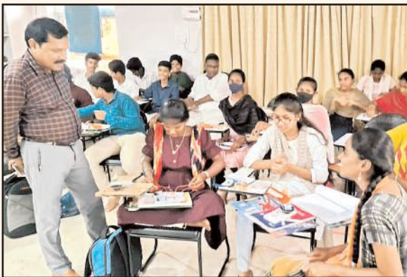
వినుకొండ, మేజర్ న్యూస్