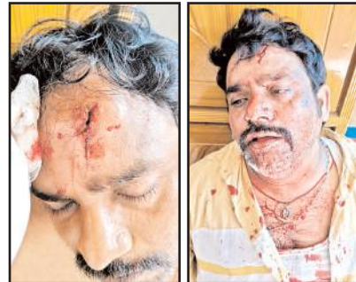
దాడి చేయడం ఒక బాధాకరమైన విషయం అని తన ఫోను ఇవ్వమని అడిగినా ఇవ్వలేదని అన్నారు.