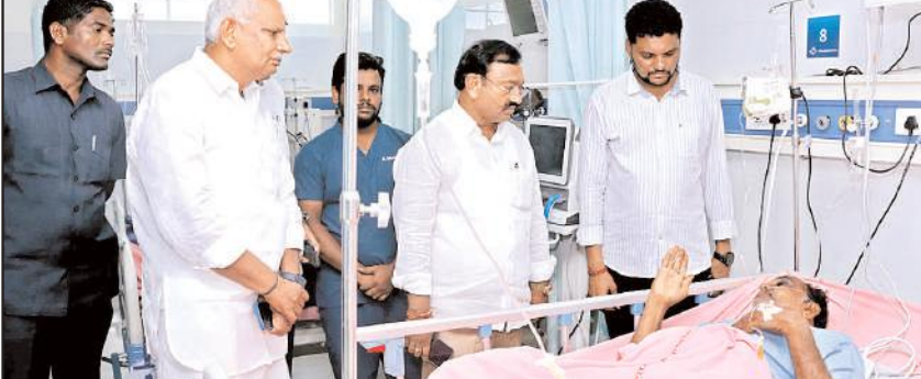
పెదకూరపాడు, మేజర్ న్యూస్: పెదకూరపాడు నియోజకవర్గంలో ఓటు భయంతోనే టీడీపీ నేతలు