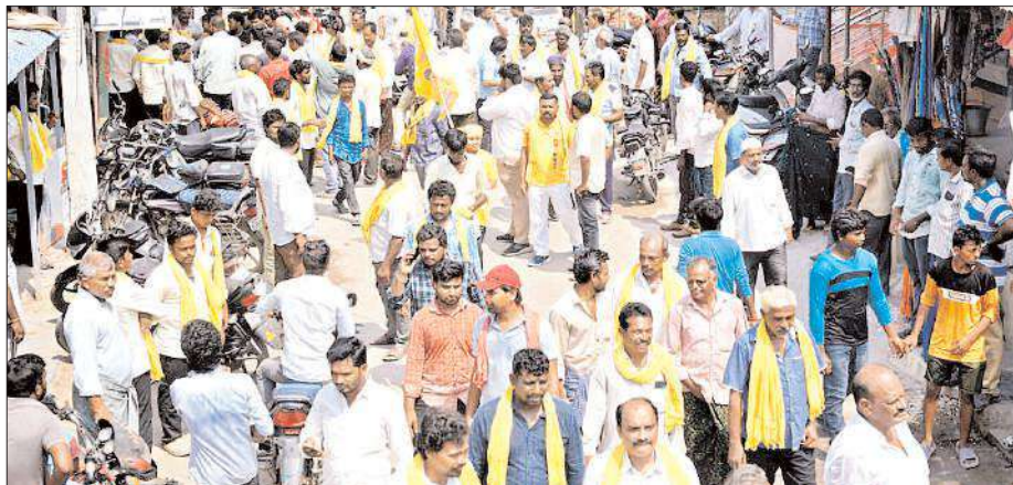
లాగేసుకుంటున్న ప్రభుత్వ విధానాలను కళ్ళకు కట్టినట్టు వివరించారు ఈ దుర్మార్గువు వైసీపీ ప్రభుత్వంలో డోపిడికి గురికాని వర్గం లేదని ఎస్సీ, ఎస్టీ బీసీ మైనార్టీ ఇలా ప్రతి వర్గం మోసం చేసిన ఘనత జగన్