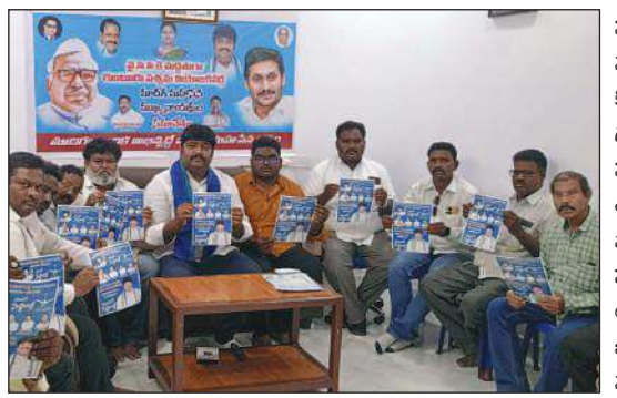
గుంటూరు, మేజర్ న్యూస్ : రాష్ట్రవ్యాప్త మాదిగ లు అందరు అభివృద్ధి లోకి రావాలంటే