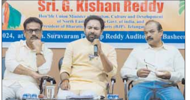
హిమాయత్ నగర్ , మేజర్ న్యూస్: ఒక్క అవినీతి ఆరోపణ కూడా లేని ఏకైక ప్రధానమంత్రి నరేంద్ర మోదీ అని, మోదీ నేతృత్వంలోని బిజెపిని ఆశీర్వదించాలని కేంద్ర మంత్రి, బీజేపీ రాష్ట్ర అధ్యక్షుడు కిష్న్ రెడ్డి అన్నారు.