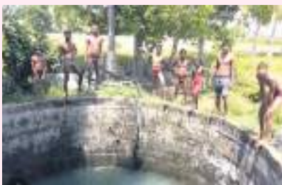
-చెరువులు, బావులే ఈతకు నిలయాలు. ముఖ్యంగా గ్రామీణ ప్రాంతంలో ఎక్కువ నీటి కుంటలు, చెరువులు బావులు ఉంటాయి. గ్రామీణ ప్రాంతాల్లోనే చిన్నారులు ఎక్కువగా స్వేచ్ఛగా

సూర్య కాల్య శ్రీరాంపూర్ వేసవికాలం వచ్చిందంటే చాలు సేదతీరేందుకు, కాలక్షేపం కోసం ప్రతి ఒక్కరు ఈతపై ఆసక్తి చూపడం సహజం. వేసవి మొదలు కావడంతో చిన్నారులు ఈత కొట్టేందుకు ఆసక్తి చూపుతారు. పెద్దలు సైతం వీలు చూసుకొని ఈత కోసం కొలనులు, చెరువులు, బావుల వద్దకు వెళ్తారు. ఈత మంచి వ్యాయామం ఆరోగ్యకరం కానీ ఈతను నేర్చుకోకుండా నీటిలో దిగడం ప్రమాదకరం. ఏటా వేసవిలో విషాదాలు కొనసాగుతూనే ఉంటాయి. కాగా పిల్లల పట్ల తల్లిదండ్రులు జాగ్రత్త కలిగి ఉండాలి. పిల్లలకు అవగాహన కల్పించాలి వారి కదలికలపై నిఘా ఉంచాలి. మరీ ముఖ్యంగా గ్రామీణ ప్రాంతాల్లోని పిల్లల తల్లిదండ్రులు ఎక్కువ శ్రద్ధ పెట్టాలి.