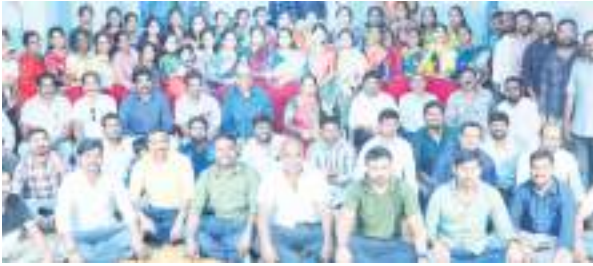
ఉన్నత స్థానాల్లో ఉన్నందుకు గర్వపడు తున్నామని పాఠశాల లో ఆనాడు చదువుకున్న జ్ఞాపకాలను గుర్తు చేసుకున్నారు. ఉపాధ్యాయులని పూలమాలలు, శాలువాలతో

గురువుల ద్వారానే ప్రతి ఒక్క విద్యార్థి ఉన్నత స్థానాల్లో ఉంటారని పలు రంగాల్లో స్థిరపడిన విద్యార్థులు అన్నారు. పట్టణంలోని ఆర్.బి రెస్టారెంట్ లో శ్రీ వాణీనికేతన్ హైస్కూల్ కి చెందిన 2003-04 వ సంవత్సర పూర్వ విద్యార్థుల సమావేశం నిర్వహించారు. పూర్వ ఉపాధ్యాయులని ఆహ్వానించి వారి చేతుల మీద జ్యోతి ప్రజ్వలన చేసి సమావేశం ప్రారంభించారు. అనంతరం వారు మాట్లాడుతూ 20 సంవత్సరాల తర్వాత