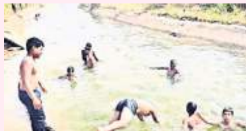
సమయంలో స్నేహితులతో కలిసి ఈతకు వెళ్లేందుకు పిల్లలు ఆసక్తి చూపుతారు. ఈత రాని కారణంగా గట్టు మీద ఉండే వారు సైతం ఆగలేక కాసేపటికీ నీటిలో దిగుతారు. ఇదే సమయంలో ప్రమాదాలు జరుగుతున్నాయి. చెరువులు, బోరుబావులు ప్రమాదాలకు నిలయంగా మారుతున్నాయి. కాగా చెరువులు, కుంటలు బావులు, వాగు వంకల్లో దూకడం ద్వారా అడుగున ఉండే బురదలో చిక్కుకుపోయి కూడా కొందరు ప్రాణాలు కోల్పోతున్నారు. ఈత వచ్చిన ఉధృతంగా పారే నీటిలో దూకడం కూడా

బయట తిరుగుతారు. అందుకే పొంచివున్న ప్రమాదాల గురించి చిన్నారులకు హెచ్చరించాలి. నిపుణులైన శిక్షకుల పర్యవేక్షణలో ఈత నేర్పించాలి. వారిని కాపాడే ప్రయత్నంలో కొందరు ఈత వచ్చిన వారి ప్రాణాలు కోల్పోతున్నా సంఘటనలు కోకొల్లలుగా చూస్తున్నాము.