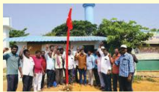
కొజిజర్ల, సూర్య (మేజర్