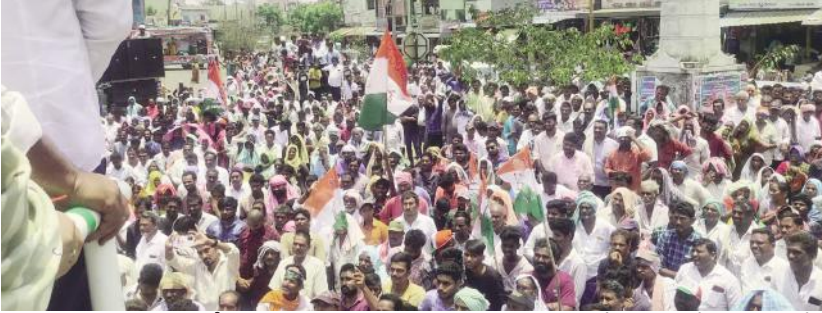
పెనుబల్లి సూర్య మేజర్ న్యూస్...

కాంగ్రెస్ పార్టీకి పనిచేసిన వారే ముఖ్యం - మట్టా దయానంద్