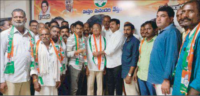
నేలకొండపల్లి సూర్య మేజర్ న్యూస్

పార్టీలో చేరిన వారికి అండగా ఉంటాం రాష్ట్ర మంత్రి పొంగులేటి శ్రీనివాసరెడ్డి