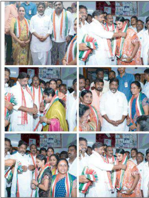
మధిర, సూర్య మేజర్ న్యూస్:

బీఆర్ఎస్ ను వీడి కాంగ్రెస్ లో చేరిన మధిర మున్సిపల్ కౌన్సిలర్లు