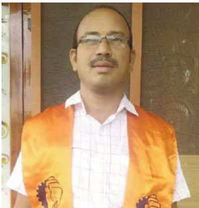
జరిగినదన్నారు. ఇది ఎన్నికల వంటి ముఖ్యమైన ఆసెన్మెంట్లో ఉద్యోగులకు నష్టమన్నారు. అలాగే, ఎస్ అండ్ పి సి సెక్యూరిటీ సిబ్బందిని