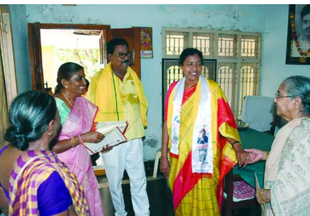
మంత్రులను చేశారని చెప్పారు. ముఖ్యమంత్రి నివాసం ఉంటున్న తాడేపల్లి ప్యాలెస్ కు కూతవేటు దూరంలోనే మహిళను మానభంగం చేసిన కేసులో శిక్షలు పడలేదన్నారు. రాష్ట్రంలో 33 వేల మంది మహిళలు మిసింగ్ అయితే సిగ్గు లేకుండా పాలన చేస్తున్నారన్నారు.

వేయలేదని చెబుతున్న జగన్ ఎక్కడ కూర్చుని పాలన సాగిస్తున్నారని ప్రశ్నించారు. జగన్ము సృహ లేకుండా మాట్లాడుతున్నారని చెప్పారు. పోలవరం ప్రాజెక్టు పూర్తి చేయలేని అసమర్థ ప్రభుత్వం వైఎస్సార్స్ లోపే అన్నారు. ఏ మాత్రం అవగాహన లేని వారిని జగన్మోహన్ రెడ్డి