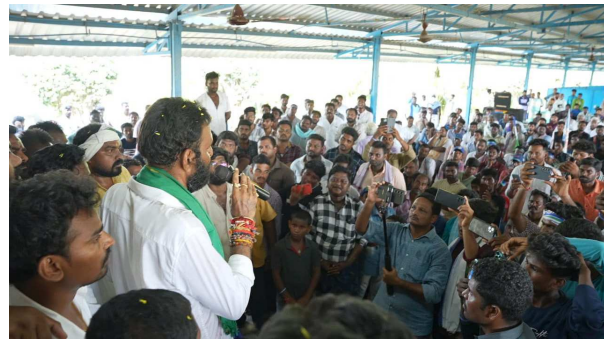
వెన్నుపోటు పొడిచారో.... పార్టీని కాపాడుకోవడానికి వాళ్లే జూనియర్ ఎన్టీఆర్ కాళ్ల దగ్గరికి వస్తారు.

తుంగలో తొక్కుతారని, లోకేష్ ను అందలం ఎక్కిస్తారని ఆరోపించారు. ఎన్టీఆర్ టిడిపి పగ్గాలు పట్టుకున్నప్పుడే అభిమానులు ఆ పార్టీకి మద్దతు ఇవ్వాలి. చంద్రబాబు నాయుడు ఆధ్వర్యంలో ఉన్న తెలుగుదేశం పార్టీని చిత్తు చిత్తుగా ఓడిస్తేనే.... పార్టీ పగ్గాలు ఎన్టీఆర్ కి వస్తాయి. ఎవరైతే పెద్ద ఎన్టీఆర్ ను