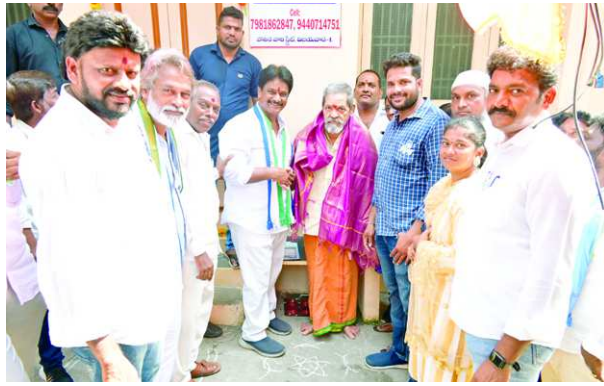
కనిపిస్తోంది. అందుకే టీడీపీ నూపర్ సిక్స్ అంటూ ఊదరగాడుతున్న మ్యూనిసిపల్స్ ను ప్రజలు నమ్మడం లేదు. అందువల్లే టీడీపీ, జనసేన

బదిళ్ళుగా తాము ఎలా ఆత్మగౌరవంతో జీవనం సాగించామో అర్థం అవుతోంది. ఇక చంద్రబాబు అధికారంలోకి వస్తే మళ్ళీ మాకు కస్టాలు, కన్నీళ్ళు తప్పవని పంచనదారులతోపాటు ప్రజలందరికీ స్పష్టంగా కళ్ళముందు