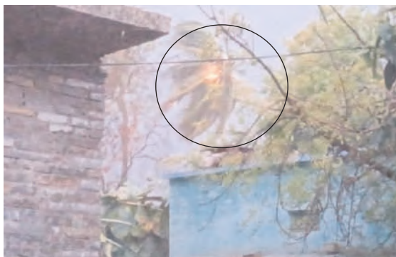
ముచ్చుమర్తిలో పిడుగు పడి కాలిపోతున్న కొబ్బరిచెట్టు

కర్నూలు, మేజర్ న్యూస్ : ద్రోని ప్రభావం కారణంగా జిల్లాలో పలు చోట్ల వర్షాలు కురిసాయి. మరో మూడు రోజులు ఈ వాతావరణం కొనసాగుతుందిని వాతావరణ శాఖ తెలిపింది. కర్నూలు నగరంలో మంగళవారం సాయంత్రం వడ గాండ వాన కురిసింది. నగరంలో ఒక్కసారిగా వాతావరణం చల్లబడింది. నందికొట్కూరు నియోజకవర్గ పరిధిలోని ముచ్చుమర్తిలో కొబ్బరి చెట్టుపై పిడుగు పడి కాలిపోయిన దృశ్యాలను కొందరు కెమెరాల్లో బంధించారు.