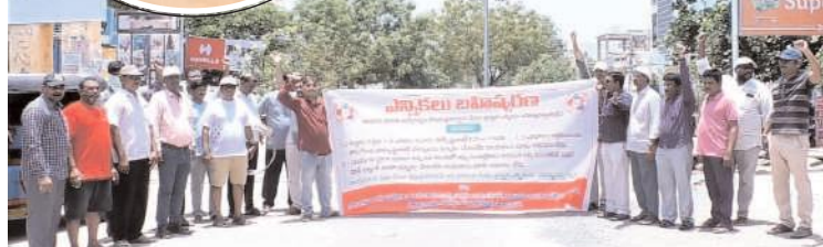
ఎన్నికలు బహిష్కరిస్తున్నామంటూ ఆందోళన చేస్తున్న 4వ తరగతి ఎంప్లాయిస్ కాలనీ వాసులు(ఫ్రైల్ ఫోటో)