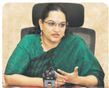
జిల్లా ఎన్నికల అధికారి / జిల్లా కలెక్టర్ జి.సృజన