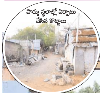
పార్కు స్థలాల్లో ఏర్పాటు చేసిన కొట్లాటు

కర్నూలు సోసైటీ, మేజర్ న్యూస్: నగరంలోని 4వ తరగతి ఎంప్లాయిస్ హౌసింగ్ సొసైటీ కాలనీలో సమస్యలు తీరడం లేదు. సొసైటీ సభ్యులు అధికారులు..పాలకుల చుట్టూ ఎన్నిరోజులు ప్రదక్షిణలు చేసినా ఎవరూ పట్టించుకోవడం లేదు. అన్యాయానికి గురైన 7.5 ఎకరాల పార్కు స్థలం కోసం సొసైటీ వాసులు ఏళ్ల తరబడి నిరీక్షించాల్సిన పరిస్థితి నెలకొంది.