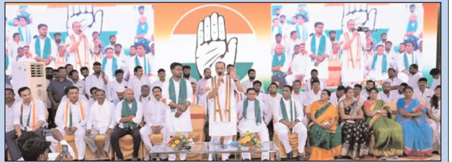
నల్గొండ జిల్లా బ్యూరో