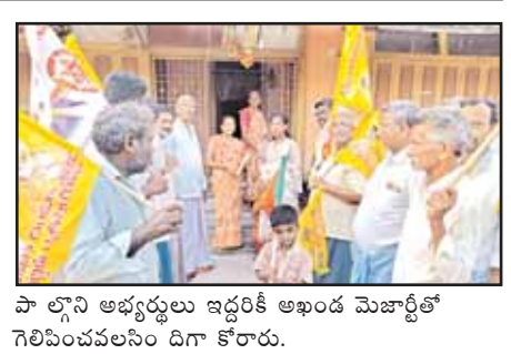
పాల్గొని అభ్యర్థులు ఇద్దరికీ అఖండ మెజార్టీతో గెలిపించవలసిందిగా కోరారు.