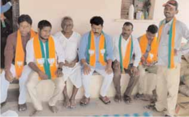
ప్రచారం చేస్తున్న బీజేపీ నాయకులు.

బహిరంగం, మేజర్ న్యూస్ (మే 02): చేపల్లె పార్లమెంటులో బీజేపీ ఎంపీ