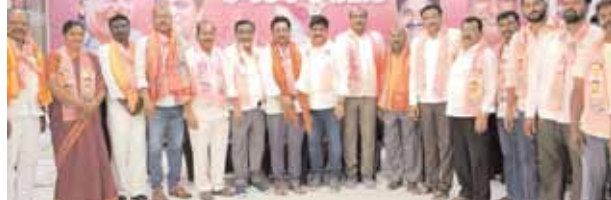
14వ డివిజన్ మాతవ కమిట