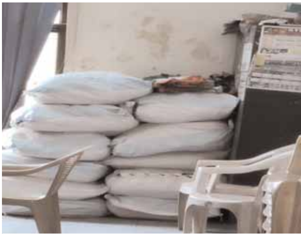
ఎంపీపీ ఛాంబర్లో పంపిణీ చేయకుండా ఓ మూలనా నంచుల్లో మూలుగుతున్న జాతీయ జెండాల