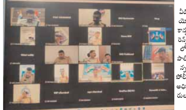
వీడియో కాన్ఫరెన్స్ లో పాల్గొన్న పోలింగ్ అధికారులు