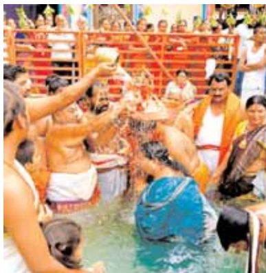
ఆలయ చైర్మన్ దంపతులకు శ్రీ చక్రస్నానం చేసిస్తున్న పండితులు.