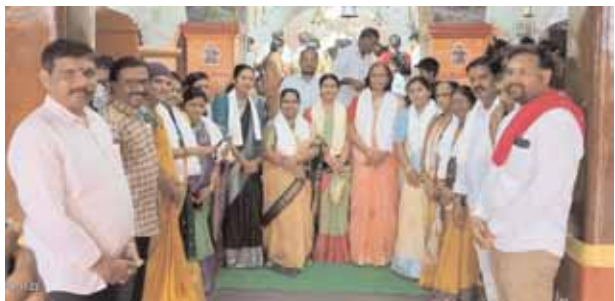
స్వామి వారి సన్నిధిలో కౌన్సిలర్స్

తాండూరు మేజర్ న్యూస్ (మే 06): తాండూరు మున్సిపల్ కౌన్సిల్ లోని బిఆర్ఎస్ పార్టీకి చెందిన పలువురు కౌన్సిలర్స్, నేతలు సోమవారం నాడు ఎన్నికల