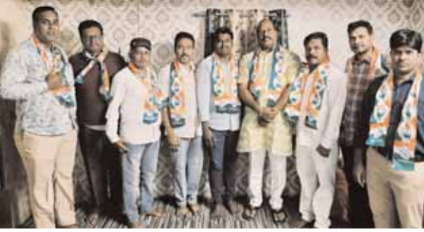
కాంగ్రెస్ పార్టీలో చేరుతున్న నాయకులు