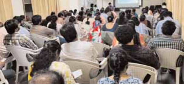
సమావేశంలో పాల్గొన్న మెడికల్ అధికారులు