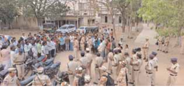
గ్రామస్తులకు అవగాహన కల్పిస్తున్న పోలీస్ అధికారులు

★ 75 వాహనాలను సీజ్ చేసిన పోలీస్ అధికారులు