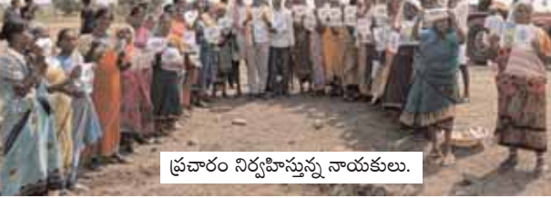
ప్రచారం నిర్వహిస్తున్న నాయకులు.