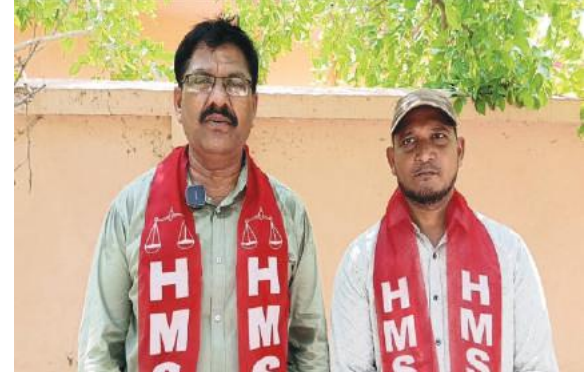
5 May 2024 14:00:26 Hanuman Basthi Kothagudem Telangana