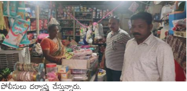
పోలీసులు దర్యాప్తు చేస్తున్నారు.