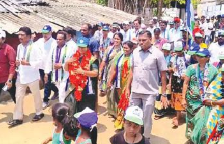
(మన్యం జిల్లా ప్రతినిధి - మేజర్ న్యూస్)

గెలుపు భీమాలో కురుపాం వైఎస్సార్ నీపీ క్యాడర్