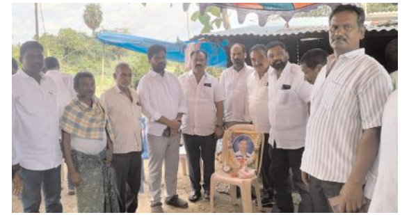
మృతుడు కుటుంబానికి నివాళులు అర్పించిన