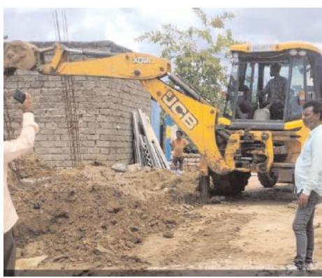
డ్రైనేజీ నిర్మాణం కోసం అధికారుల తాత్కాలిక ఏర్పాటు