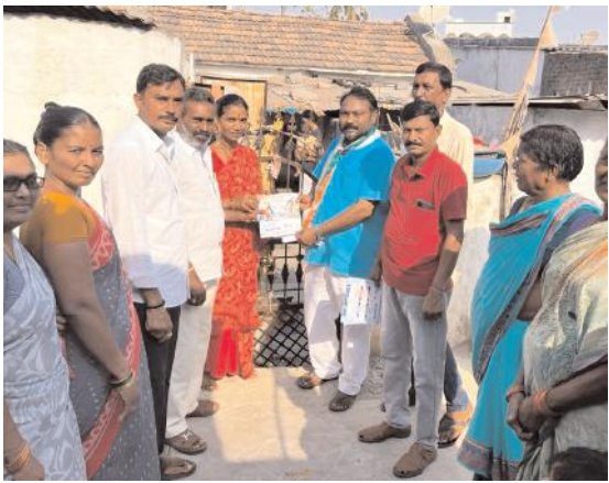
కాంగ్రెస్ పార్టీ అధ్యక్షులలో తొర్రూర్16 వ వార్డులో