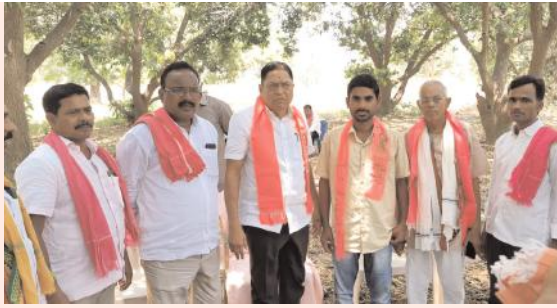
కవితను గెలిపిద్దాం కాంగ్రెస్ పార్టీకి బుద్ధి చెబుదాం