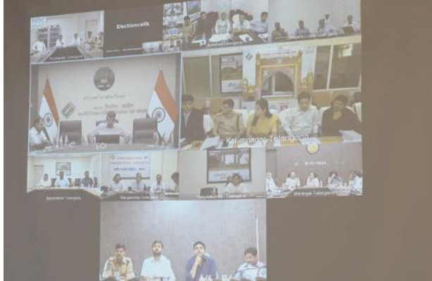
ర్యాండమైజేషన్ ప్రక్రియ పూర్తి చేయాలని, వంద శాతం ప్రతి ఓటరుకు ఓటర్ సమాచార స్లిప్ల పంపిణీ చేయాలని పోలింగ్ సిబ్బందికి అవసరమైన మౌఖిక వసతులు కల్పించాలని, డబ్బు, మధ్యం పంపిణీ జరగకుండా పక్కా నిఘా ఏర్పాటు చేయాలన్నారు.సి విజల్ యాప్ ను ప్రజల్లోకి మరింత విస్తృతంగా తీసుకుని వెళ్ళాలని తెలిపారు.