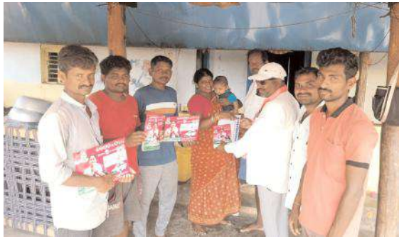
లక్ష్మీపురంలో ఇంటింటి ప్రచారం