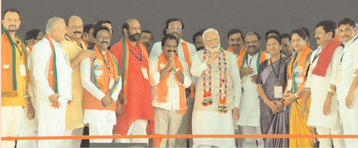
మొదటి పేజీ తరువాయి..

మూడు విడతల్లో జరిగిన ఎన్నికల్లో బిజేపి విజయం ఖాయమైంద న్నారు. మూడు దశల్లో కలిపి కాంగ్రెస్ గెలిచే సీట్లు కనిపించడం లేదని అందుకే ఆ పార్టీ ఇప్పుడు గెలిచే సీట్లను భూతద్దం పెట్టి చూసుకుంటున్నదని చెప్పారు. నాలుగో దశ తరువాత మైక్రో స్కోప్ పెట్టుకుని చూడాల్సి ఉంటుందని తెలిపారు. మా కర్మ భూమి అహ్మదాబాద్లో ఇక్కడి భద్రకాళీ మాత ఉంటుందని అన్నారు. మాకు వరంగల్ చాలా ముఖ్యమైనదని , 40 ఏండ్ల శ్రీతమే బిజేపి వరంగల్ సీటు గెలిచిందని చెప్పారు. ఎప్పుడు కష్టం వచ్చినా బిజేపికి అండగా ఉన్నారని పేర్కొన్నారు.