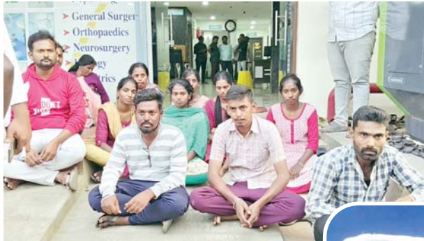
రోగిపట్ల నిర్లక్ష్యం చేశారని బంధువుల ఆందోళన