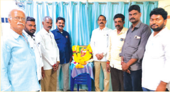
నరసరావుపేట రూరల్, మేజర్ స్టూన్స్: