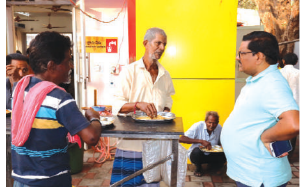
అభిప్రాయాలను క్యూఆర్ కోడ్ ద్వారా తెలియ చేయవచ్చన్నారు.