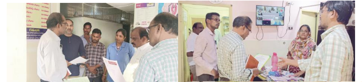
-అధికారి డాక్టర్ మురళీధర్ -ఆస్పత్రులలో ఆకస్మికంగా తనిఖీ

మహబూబాబాద్ జిల్లా ప్రతినిధి, మార్చి 13, మేజర్ న్యూస్ (సూర్య ):ఆసుపత్రిలోని రికార్డులను నిర్వహణ సక్రమంగా చేపట్టాలని జిల్లా అధికారి డాక్టర్ మురళీధర్ సూచించారు.జిల్లా వైద్య ఆరోగ్య శాఖ అధికారి డాక్టర్ మురళీధర్ నేతృత్వం లో మహబూబాబాద్ పట్టణంలోని ప్రైవేట్ ఆసుపత్రులను, స్పానింగ్ సెంటర్లను ఆకస్మికంగా తనిఖీ చేశారు.పట్టణంలోని ఆయుష్ హాస్పిటల్ ను పరిశీలించినప్పుడు ఆసుపత్రిలోని రికార్డులను నిర్వహణ సక్రమముగా చేయాలని రికార్డ్ లను రెండు సంవత్సరాల వరకు భద్రపరచాల్సి ఉంటుందని తెలిపారు. ఆరోగ్య హాస్పిటల్ స్పానింగ్ సెంటర్ ను పరిశీలించినప్పుడు రికార్డుల నిర్వహణ సరిగా లేనందున షోకాజు నోటీసు జారీ చేస్తున్నట్లు, అనంతరం శారద నర్సింగ్ హోంను తనిఖీ చేశారు. అంతే కాకుండా ప్రైవేట్ హాస్పిటల్లో నిర్వాహకులు వారు అందించి సేవలకు