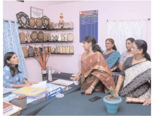
చెప్పారు. ప్రిన్సిపల్ శైలజ, ఉపాధ్యాయులు, అధ్యాపకులతో మాట్లాడి సమస్యలను కలెక్టర్ అడిగి తెలుసు కున్నారు. యధాస్థానానికి పాఠశాల, కళాశాలను తరలించేందుకు అక్కడ కావాల్సిన వసతి సదుపాయాల గురించి ప్రతిపాదనలు సమర్పిస్తే వాటిని మంజూరు చేయనున్నట్లు కలెక్టర్ వెల్లడించారు. అనంతరం పదో తరగతి విద్యార్థినులకు కలెక్టర్ పరీక్ష ప్యాడ్లు, పెన్సులు, ఇతర పరీక్ష సామాగ్రి అందజేశారు. పదో తరగతి హాల్ టెస్ట్లను కలెక్టర్ చేతుల మీదుగా పంపిణీ చేశారు. కార్యక్రమంలో పాఠశాల, కళాశాల ఉపాధ్యాయులు, అధ్యాపకులు, విద్యార్థినులు పాల్గొన్నారు.