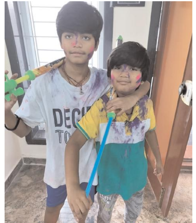
కామదహనం నిర్వహించారు. జిల్లా కేంద్రాలతో పాటు పట్టణాలు, గ్రామాల్లోని చౌరస్తాల వద్ద పూజలు చేసి కామదహనం చేశారు. శుక్రవారం హోలీ సందరాలు నిర్వహించనున్నారు.