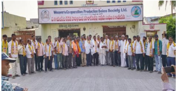
జిల్లా ప్రధాన కార్యదర్శిని సన్మానించిన పద్మశాలి నాయకులు