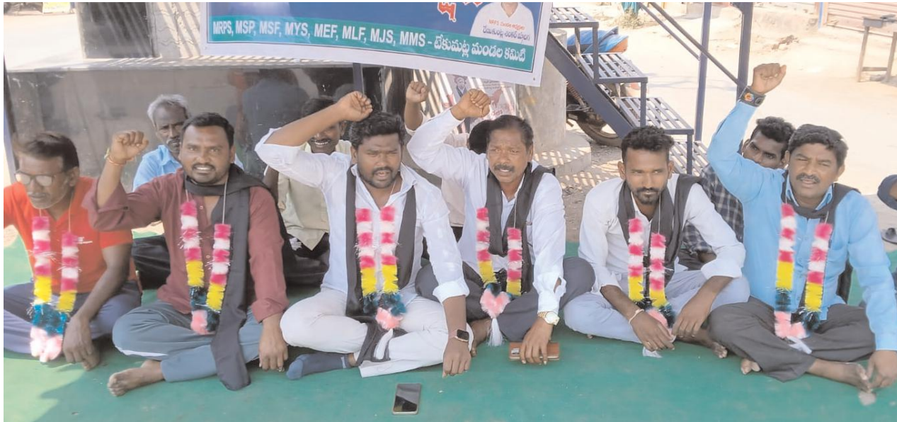
నాల్గవ రోజు కొనసాగుతున్న రిలే నిరాహార దీక్షలు