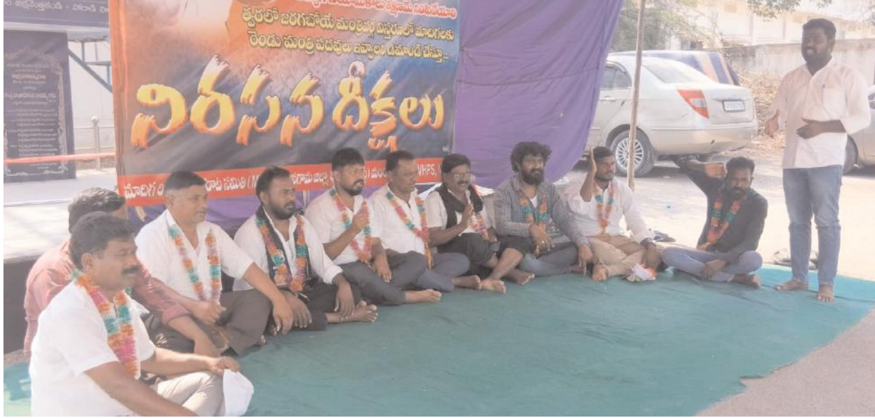
అసెంబ్లీలో సంపూర్ణమైన వర్గీకరణ చట్టాన్ని తక్షణమే తీసుకు రావాలి