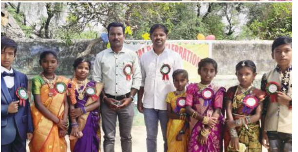
అంగన్నాడి టీచర్ రూన్స్ విద్యార్థిని విద్యార్థులు గ్రామస్థులు తదితరులు పాల్గొన్నారు.