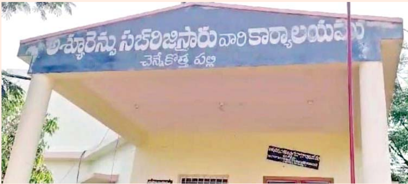
కావాలన్నా.. చివరికి నకలు పొందాలన్నా.. ఆ రెడ్లు

అనంతపురం మేజర్ న్యూస్ : పేరుకు మాత్రమే అది రాజకీయంగా రాష్ట్రంలోనే సున్నితమైన నియోజకవర్గం. ఇక్కడ నిత్యం వైసిపి.. టిడిపి నేతల మధ్య వర్గ చోరు జరుగుతుందన్నది పెద్ద ఎత్తున ప్రచారం. అప్పుడప్పుడు కొన్ని సంఘటనలు కూడా ఈ ప్రచారాన్ని రూడి చేస్తుంటాయి. అయితే ఎంతో సున్నితమైన నియోజకవర్గంగా చెప్పుకునే రాష్ట్రాదు నియోజకవర్గంలోని సికె పల్లి రిజిస్ట్రార్ కార్యాలయం మాత్రం ఇందుకు అతీతంగా ఉంది. సహజంగా ఏ ప్రభుత్వం అధికారంలోకి వస్తే ఆ పార్టీ నేతల మాటకు బలం పెరుగుతుంది. అయితే కూటమి ప్రభుత్వం లో కూడా వైసిపి వాసనలే అన్న ఆరోపణలకు నిలువెత్తు సాక్ష్యంగా నిలుస్తోంది ఈ కార్యాలయం.