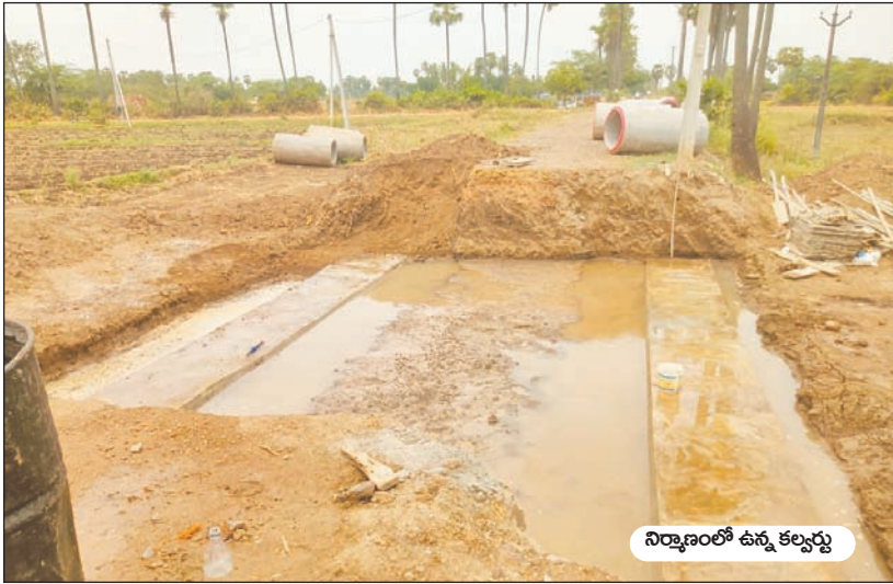
నిర్మాణంలో ఉన్న కల్వర్టు

అవనిగడ్డ, మేజర్ స్వ్యాస్ : మండల పరిధిలోని దక్షిణ చిరువోలు లంక రహదారిపై నిర్మిస్తున్న కల్వర్టు పనులు నత్తనడకన సాగుతున్నాయి. గత 15 రోజులుగా కల్వర్టు నిర్మాణం కోసం రహదారిని తప్పి తూములు సిద్ధం చేసుకున్నప్పటికీ పనులు కొనసాగక పోవడంతో గ్రామస్థులు ప్రమాదాలకు గురై తీవ్ర ఇబ్బందులు ఎదుర్కొంటున్నారు. అవనిగడ్డ నుండి దక్షిణ చిరువోలు లంక వెళ్లే కృష్ణా కరకట్ట కింద భాగంలో వర్షాకాలంలో, వరదల సమయంలో వరద నీరు రాకుండా కలవర్టు నిర్మాణం కోసం రహదారి తప్పి కాంట్రా