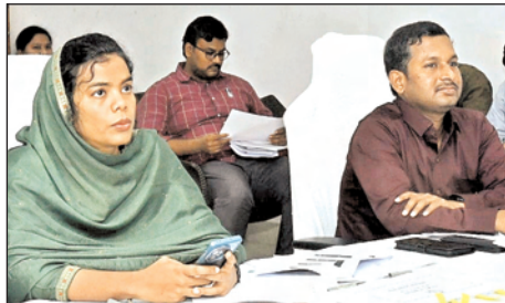
పిజిఆర్ఎస్ దరఖాస్తులు బియాండ్ ఎన్ఎల్ఎలోపు వెళ్లకుండా గడువులోపు నాణ్యతగా పరిష్కరించాలని