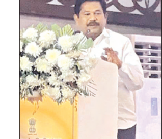
ఆసక్తిగా తిలకించారు. ప్రజెంటేషన్ ఆనంతరం మంత్రి డోలా శ్రీ బాల

వీరాంజనేయ స్వామి మాట్లాడుతూ సీఎం చంద్రబాబు నాయుడు తన విజన్ తో ఏపిలో పేదరిక నిర్మూలనకు కృషి చేస్తున్నారు. విజన్ 2047లో భాగంగా ఉగాది నాడు పి-4 పథకం ప్రారంభించి పేదలను ఆర్థికంగా, సామాజికంగా అభివృద్ధి అభివృద్ధి చేసేందుకు చర్యలు చేపట్టారు. సమాజంలో 10 శాతం ఉన్న ధనవంతులు 20 ఉన్న పేదల