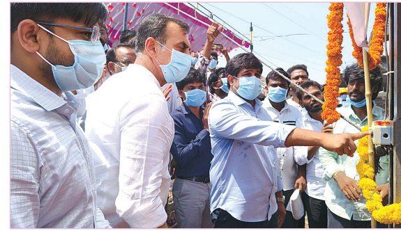
కడప ప్రతినిధి - మేజర్ స్యూస్

చింతకొమ్మాయిని మండలం కోలుముల పల్లె పంచాయతీలోని ఎస్టీపీసీ - మద్దిమడుగు నర్సరీ ఎదురుగా రూ.30 కోట్ల తో 4 నాలుగు లక్షల టన్నుల సామర్థ్యం కలిగిన బయో రిమిడియేషన్ కమలాపురం ఎమ్మెల్యే పుత్తూ కృష్ణ చైతన్య రెడ్డి ప్రారంభించారు. స్వచ్ఛంద్ర - కడప మున్సిపల్ కార్పొరేషన్ అధ్యక్షులతో డంపింగ్ యార్డులో బయో ..మిగతా 2పేజీలో