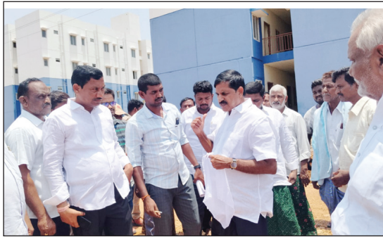
నాయకులు అధికారులు ప్రజలు పాల్గొన్నారు.