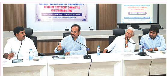
కడప ప్రతినిధి - మేజర్ స్యూస్:

వేసవి సమస్యలను అధికమించాలి విద్యుత్ మౌలిక సదుపాయాలు - అభివృద్ధిపై సమీక్ష