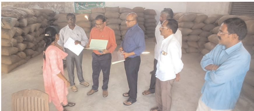
పరిగి, మేజర్ న్యూస్ (ఏప్రిల్ 09):

పరిగి మండలంలో పరిగి సుల్తాన్ పూర్ గ్రామంలోని డిసిఎంఎస్ వల కొనుగోలు కేంద్రాన్ని