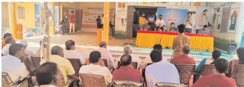
సమావేశంలో పాల్గొన్న రైతులు తదితరులు

సంబంధించిన లబ్ధిదారుల జాబితాను అధికారులు వెల్లడించారు. అధికారుల ప్రకారం, భూమిని పూర్తిగా కోల్పోయిన కుటుంబాలకు ఒక్కొక్కరికి రూ.11.64 లక్షల చొప్పున, ప్రభావితులుగా గుర్తించిన కుటుంబాలకు రూ.6 లక్షల చొప్పున