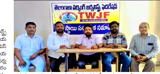
ఉదయం 10 గంటలకు ప్రారంభమయ్యే ఈ తెలిపారు. గత వారం రోజులుగా జిల్లాలో విరివిగా