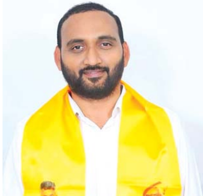
వింజమూరు, మేజర్ న్యూస్ : నిరుద్యోగ యువత