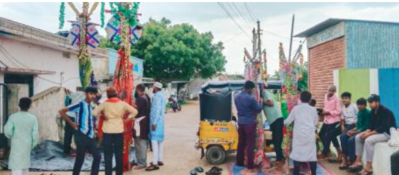
కొల్చారం మేజర్ న్యూస్: మెదక్ జిల్లా కొల్చారం మండలం లో మొహరం ఇస్లామిక్ క్యాలెండర్లో తొలి నెల, కొత్త సంవత్సర ప్రారంభానికి సూచిక. మొహరం మాసం 10వ రోజున వచ్చే రోజుని అఫురా అని పిలుస్తారు. ఇది విషాదానికి, సంఘానికి చెందినది. రాచరిక వ్యవస్థ నశించి ప్రజాస్వామ్య పాలన రావాలని కోరుతూ మహమ్మద్ ప్రవక్త మనుమలైన హసన్, హుసైన్లు కర్బలా మైదానంలో యుద్ధం చేసి కుటుంబ సభ్యులు, అనుచరులతో సహా వీరమరణం పొందుతారు. వారి త్యాగనిరతిని, అమరత్వాన్ని స్మరిస్తూ ముస్లింలు మొహరంను జరుపుకుంటారు. ప్రత్యేక ప్రార్థనలు, ఊరేగింపులు నిర్వహిస్తారు. పేదలకు సాయం చేస్తారు. ఉపవాసం పాటిస్తారు. అధర్మం, అన్యాయాలను వ్యతిరేకించి ధర్మం కోసం ప్రతి ఒక్కరూ పాటుబడాలని,