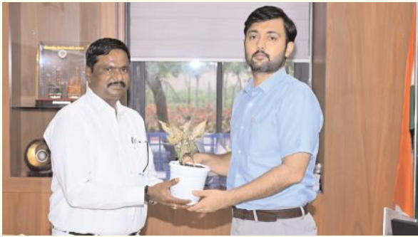
జిల్లా కలెక్టర్ ను కలిసిన ఫోకోకోర్లు