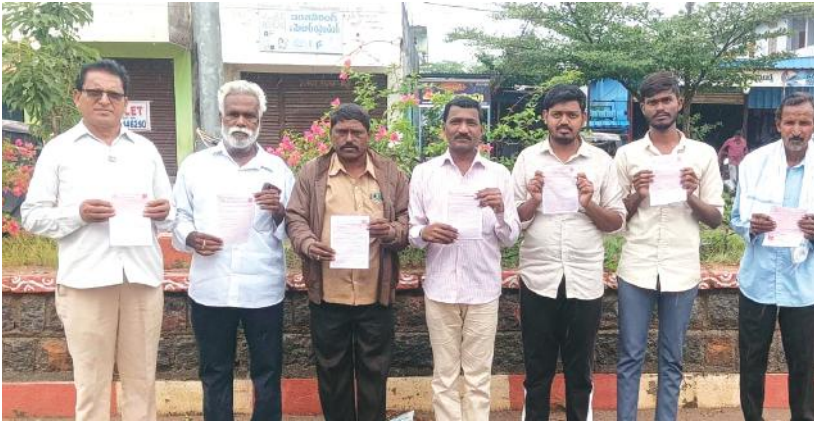
సెయింట్ మేరీ పాఠశాలపై చర్య తీసుకోవాలని