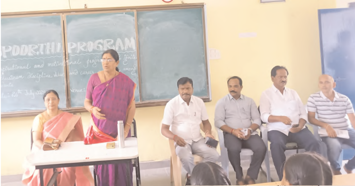
జిల్లాలోని 13 మండలాల్లోని 73 ప్రభుత్వ విద్యా సంస్థల్లో స్ఫూర్తి కార్యక్రమం నిర్వహణ