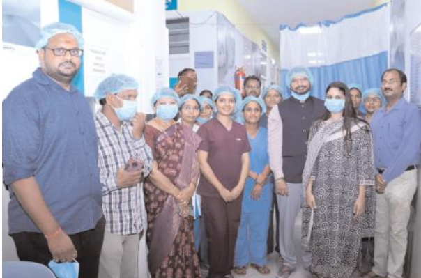
అమ్మ గా పాలు తాపించింది. బిడ్డలు దేవుడు ఇచ్చే వరమని అలాంటి బిడ్డలను అనాధ గా వదిలి వెళ్ళి పోవడం చాలా బాధాకరమన్నారు.