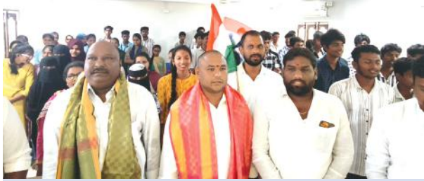
జనగామ జిల్లా సూర్య ప్రతినిధి, జూలై 26:-