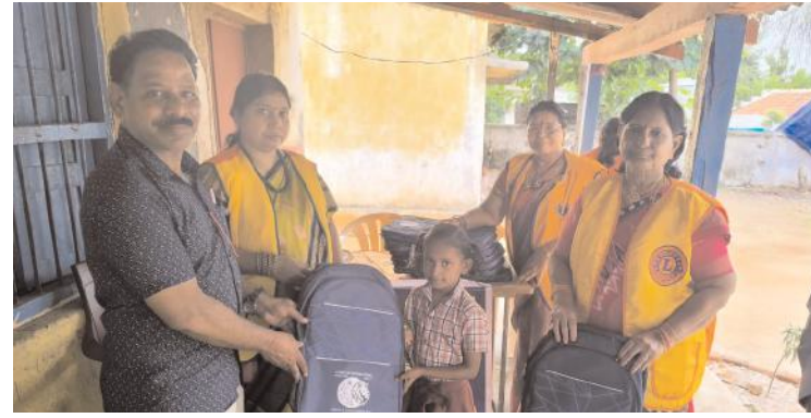
నడి కూడ ఆగస్టు 4 మేజర్ న్యూస్ సూర్య