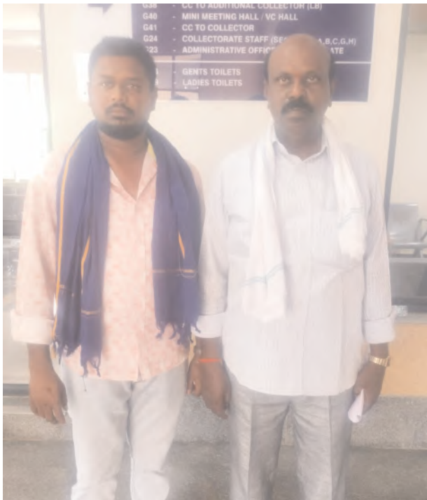
డేంజర్ జోన్ నుండి ప్రజలను సురక్షిత ప్రాంతాలకు తరలించేందుకు సత్వరమే చర్యలు తీసుకోవాలని విజ్ఞప్తి చేశారు. లేని పక్షంలో డేంజర్ జోన్ ప్రజలతో పెద్ద ఎత్తున సెప్టెంబర్ నుండి మండల తహసీల్దార్ కార్యాలయం ఎదుట నిరవధిక రిలే నిరహార డీక్షలు చేపడతామని హెచ్చరించారు.