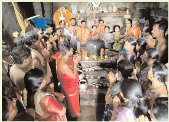
కోటగుళ్లలో ఘనంగా శ్రావణ సోమవారం పూజలు ఆలయంలో భక్తుల కోలాహలం స్వామివారికి రుద్రాభిషేకం పట్టు వస్త్రాలతో ప్రత్యేక అలంకరణ