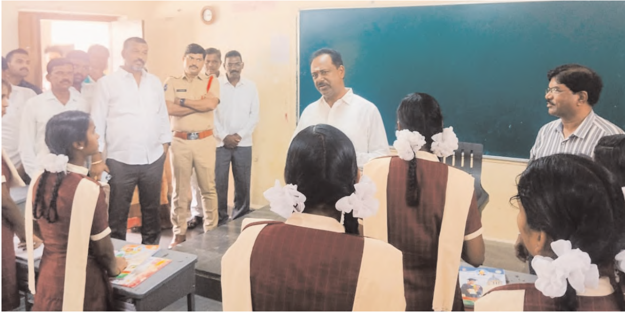
బాలికల గురుకుల పాఠశాలను సందర్శించిన ఎమ్మెల్యే జీఎస్సార్ మాలిక వసతులపై కృషి