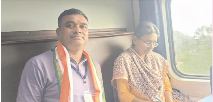
కమలాపూర్ ఆగస్టు 04 మేజర్ న్యూస్ సూర్య :-