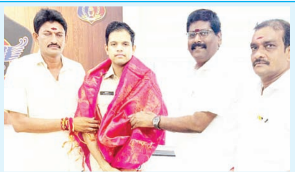
రేవు ఎమ్మెల్యే రాముచే నవరాత్రుల ప్రారంభం