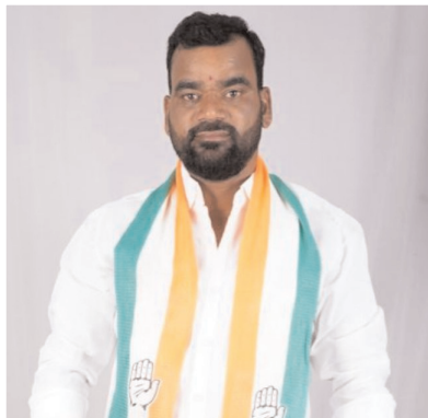
లోక నర్సిములు మాజీ సర్పంచ్ ( చాన్యూపూర్)