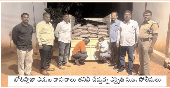
టోల్ఫ్లాజా ఎదుట వాహనాలు తనిఖీ చేస్తున్న ఎక్సైజ్ సి.ఐ, పోలీసులు

కొద్దిసేపట్లోనే పి 28వై 6303 నంబర్ గల ఆటో వాహనంను ఆపి తనిఖీ చేయగా అందులో ఒక్కొక్క బ్యాగులో 30 కిలోల చొప్పున 10 బ్యాగుల్లో 300 కిలోల నల్లబెల్లం పొందడం గుర్తించడం జరిగిందని, అదేవిధంగా 10 కిలోల పటికను కూడ గుర్తించి అక్రమంగా నాటుసారా తయారీకి ఉపయోగించే నల్లబెల్లం, పటికను రవాణా చేస్తున్న రెండు