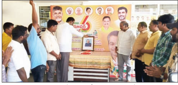
గొల్లపూడిలోని ఎమ్మెల్యే కార్యాలయంలో..