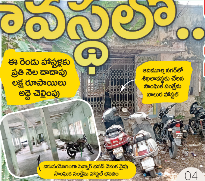
ఈ రెండు హాస్టళ్లకు ప్రతి నెల దాదాపు లక్ష రూపాయలు అద్దె చెల్లింపు