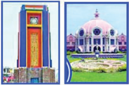
సోమవారం, 17 నవంబర్ 2025