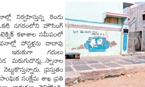
ప్రస్తుతం హౌసింగ్ బోర్డులో అద్దెకు నిర్వహిస్తున్న సాంఘిక సంక్షేమ బాలుర కళాశాల హాస్టల్

► మొదటి పేజీ తరువాతి నగరంలో ప్రస్తుత అద్దె భవనాల్లో నిర్వహిస్తున్న రెండు సంక్షేమ బాలుర హాస్టళ్లలో... ఒకటి నగరంలోని హౌసింగ్ బోర్డు శివారు, మరొకటి పాలిటెక్నిక్ కళాశాల సమీపంలో నిర్వహిస్తున్నారు. ఈ అద్దె భవనాల్లో హాస్టళ్లను దాదాపు పదేళ్లుగా నిర్వహిస్తున్నా... ఇరుకుగా గదులు కావడంతో.. విద్యార్థులకు సరిపడ మరుగుదొడ్లు.. స్నానాల గదులు లేక ఇబ్బందుల మధ్య నెట్టుకొస్తున్నారు. ప్రస్తుతం ఈ రెండు అద్దె హాస్టళ్లకు జిల్లా సాంఘిక సంక్షేమ శాఖ ప్రతి నెల దాదాపు లక్షల రూపాయిలు బాడుగలు చెల్లిస్తోంది. హౌసింగ్ బోర్డు శివారులో నిర్వహిస్తున్న బాలుర కళాశాల హాస్టల్ నగరానికి శివారు కావడంతో.. అక్కడి నుంచి విద్యార్థులు.. ఎస్ఎస్బిఎస్, ఆర్ట్స్ కళాశాలలకు వెళ్లి రావాలంటే. ప్రతి రోజు దాదాపు ఐదు నుంచి ఆరు కిలోమీటర్లు సదుమకుంటూ వెళ్లి రావాలంటే ఆలసిపోతున్నారు. గతంలో విద్యార్థి సంఘాలు, విద్యార్థులు ఈ హాస్టల్ను మార్చాలని... జిల్లా కలెక్టరేట్లో గ్రేవెన్స్లో అధికారులకు వినతిపత్రాలు కూడా అందచేశారు. అయినప్పటికీ ఇంత వరకు మార్చలేదు. పాలిటెక్నిక్ సమీపంలో బాలుర హాస్టల్ నిర్వహిస్తున్న భవనం కూడా.. పాతది కావడంతో.. ఇరుకుగదుల్లోనే కొనసాగిస్తున్నారు. ఇలా ఇబ్బందుల మధ్య సంక్షేమ హాస్టల్లో విద్యార్థులు చదువును కొనసాగిస్తున్నారు. సొంత స్థలాల్లో... సాంఘిక సంక్షేమ నూతన హాస్టళ్ల నిర్మాణానికి నిధులు మంజూరు చేయాలి : కుటుంబ ప్రభుత్వాన్ని డిమాండ్ చేస్తున్న జిల్లా విద్యార్థి సంఘాలు