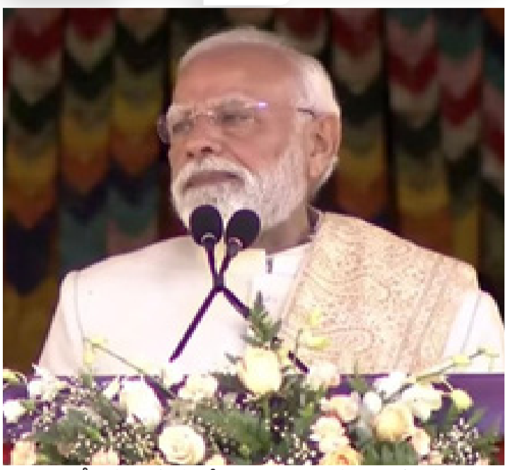
వ్యాఖ్యలు చేశారు. తాను ఈ రోజు చాలా బరువైన హృదయంతో ఇక్కడికి వచ్చానని ఆయన అన్నారు. సోమవారం సాయంత్రం ఢిల్లీలో జరిగిన భయంకరమైన సంఘటన అందరినీ తీవ్రంగా బాధపెట్టిందన్నారు. బాధిత కుటుంబాల బాధను తాను అర్థం చేసుకున్నానని.. దేశం మొత్తం వారికి అండగా నిలుస్తుందన్నారు. ఈ సంఘటనపై దర్శాప్తు చేస్తున్న అన్ని సంస్థలతో తాను ఎప్పికవ్వడూ సంప్రదింపులు జరుపుతున్నట్లు తెలిపారు. జ్వరలోనే దర్శాప్తు సంస్థలు ఈ కుట్ర మూలాలను కనుగొంటారని.. దీని వెనుక ఉన్న కుట్రదారులను పదిలిపెట్టే ప్రసక్తే లేదని హెచ్చరించారు.

రెండ్రోజుల పర్యటనలో భాగంగా మంగళవారం భూటాన్ చేరుకున్న భారత ప్రధాని నరేంద్ర మోదీ, ఎయిర్పోర్టుకు చేరుకున్న ప్రధాని మోదీకి భూటాన్ ప్రధాని స్వాగతం పలికారు. ఈ సందర్భంగా రెండు దేశాల మధ్య స్నేహం, సహకారం ప్రత్యేక సంబంధాలను బలోపేతం చేయడమే ప్రధాని మోదీ లక్ష్యంగా పెట్టుకున్నారు. భారతదేశం, భూటాన్ సంయుక్తంగా అభివృద్ధి చేసిన 1020 మెగావాట్ల పునర్నిర్మాణ-2 బలవిద్యుత్ ప్రాజెక్టును మోదీ, ఆదేశ ప్రధాని కింగ్ వాంగ్యుక్ సంయుక్తంగా ప్రారంభించనున్నారు. అలాగే భూటాన్ నాలుగవ రాజు జిగ్యే సింగ్యే వాంగ్యుక్ 70వ జయంతి వేడుకలకు ప్రధాని మోదీ హాజరుకానున్నారు. భూటాన్ చేరకున్న ప్రధాని మోదీ అక్కడ ఏర్పాటు చేసిన కార్యక్రమంలో పాల్గొన్నారు. ఈ సందర్భంగా ఆయన మాట్లాడుతూ సోమవారం ఢిల్లీలో జరిగిన పేలుడు ఘటనపై ఆయన కీలక