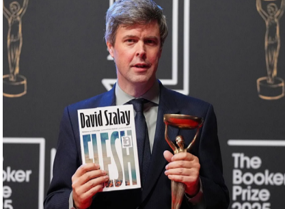
రాసిన 'ద ఇన్హెరిటెన్స్' అఫ్ లాస్ నవలకు అమెరికా బూకర్ ప్రైజ్ వచ్చింది. అయితే ఈ సారి కూడా అ అవార్డు కోసం ఆమె తీవ్ర పోటీపడ్డారు.

హంగేరికి చెందిన బ్రిటిష్ రచయిత డేవిడ్ సాల్.. 2025 బూకర్ ప్రైజ్ గెలుచుకున్నారు. ఫ్లెట్ అనే నవలకు గాను ఆయనకు ఈ అవార్డు వలంబించింది. లండన్లో సోమవారం రాత్రి బూకర్ ప్రైజ్ వేడుక జరిగింది. భారతీయ రచయిత కిరణ్ దేశాయ్ రాసిన 'ద లోస్ట్ సెన్ ఆఫ్ సోనియా' అండ్ సన్స్ నవల తీవ్ర పోటీ ఇచ్చింది. కానీ చివరకు డేవిడ్ రాసిన నవలకు అవార్డు దక్కింది. 51 ఏళ్ల డేవిడ్ సాల్కు సుమారు 50 వేల పాఠకుల సగటు పురస్కారం అందజేశారు. గత ఏడాది విన్నర్ సుమంతా హాన్స్ చేతుల మీదుగా ట్రోఫీని బహూకరించారు. కిరణ్ దేశాయ్ రెండోసారి ఈ అవార్డు కోసం పోటీపడ్డారు. 2006లో